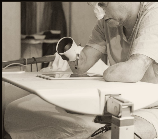
IN DER REHA, 2025